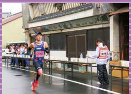
写真は第51回大会のものです。